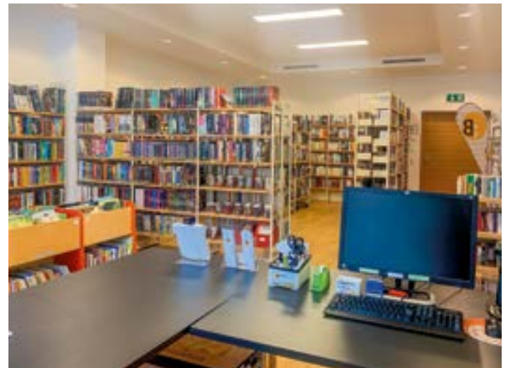
Das Ersatzsommerquartier im z'enTRUM