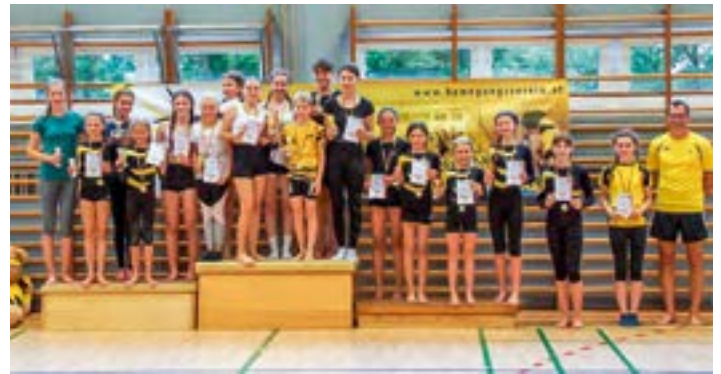
Die älteren Kinder der Mittwochsgruppen