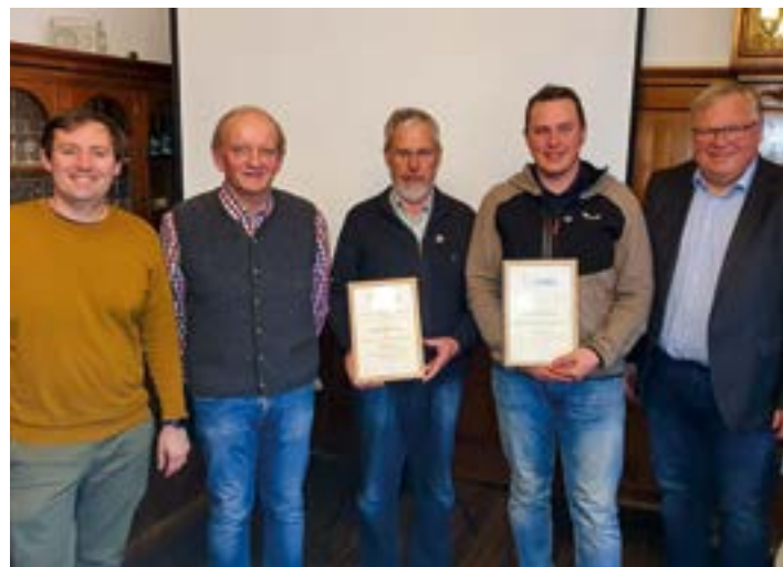
Auszeichnung 10 Jahre Mitgliedschaft