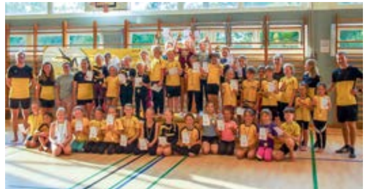
Alle jüngeren Kinder der Montagsgruppen