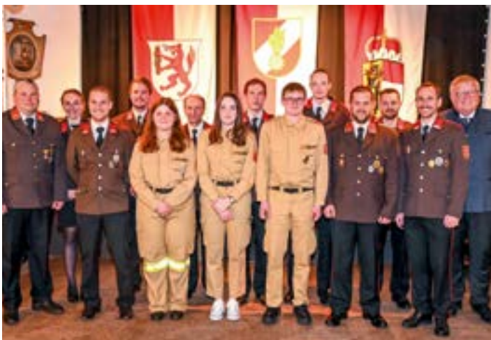
Ehrungen, Beförderungen und Überstellungen